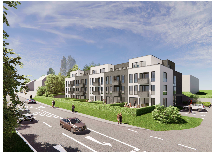
Ansicht Rathausstrasse/Alte Molkerei