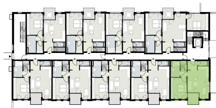
Übersichtsplan - Erdgeschoss