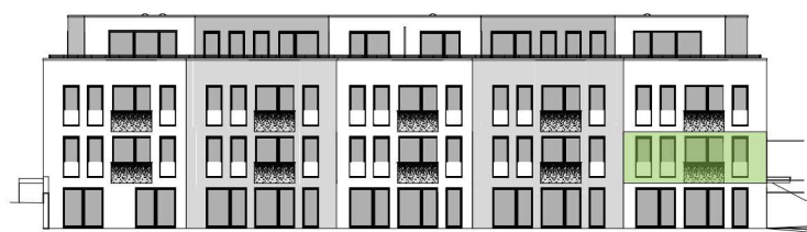
Übersichtsplan - Ansicht_Nord-West